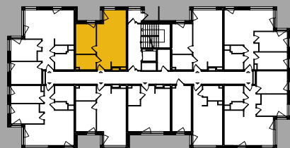
Położenie na kondygnacji