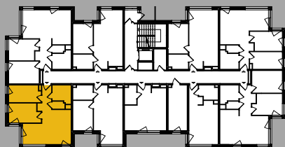
Położenie na kondygnacji