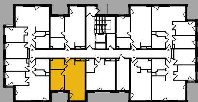
Położenie na kondygnacji