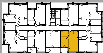
Położenie na kondygnacji