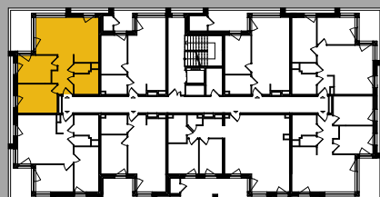
Położenie na kondygnacji