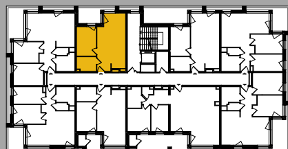
Położenie na kondygnacji