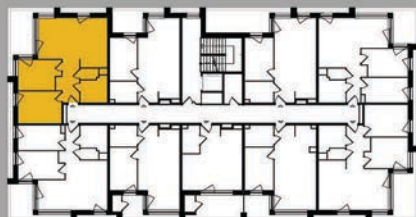
Położenie na kondygnacji