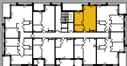
Położenie na kondygnacji