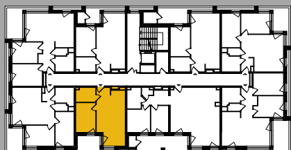
Położenie na kondygnacji